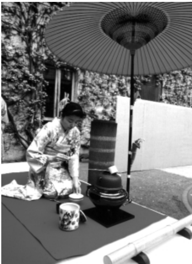
Scéna z japonského čajového obřadu pořádaného v zahradě pro větší počet lidí